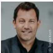
Lars Klingbeil Bundvorsitzender der SPD