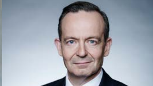
Dr. Volker Wissing

Bundesminister für Digitales und Verkehr