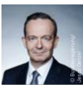
Dr. Volker Wissing Bundesminister für Digitales und Verkehr