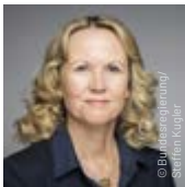
Steffi Lemke Bundesministerin für Umwelt, Naturschutz, nukleare Sicherheit u. Verbraucherschutz