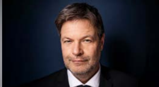
Dr. Robert Habeck

Bundesministerin für Umwelt, Naturschutz, nukleare Sicherheit und Verbraucherschutz