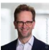
Klaus Müller Präsident der Bundesnetzagentur