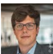
Dr. Lukas Köhler Stellvertretender Vorsitzender der FDP- Bundestagsfraktion