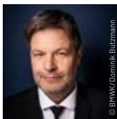
Dr. Robert Habeck Bundesminister für Wirtschaft und Klimaschutz