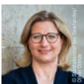
Anke Rehlinger Ministerpräsidentin des Saarlandes