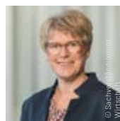
Prof. Dr. Veronika Grimm Mitglied des Sachver- ständigenrates