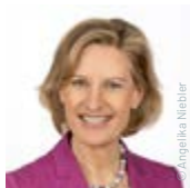
Angelika Niebler MdEP, Fraktion der Euro- päischen Volkspartei